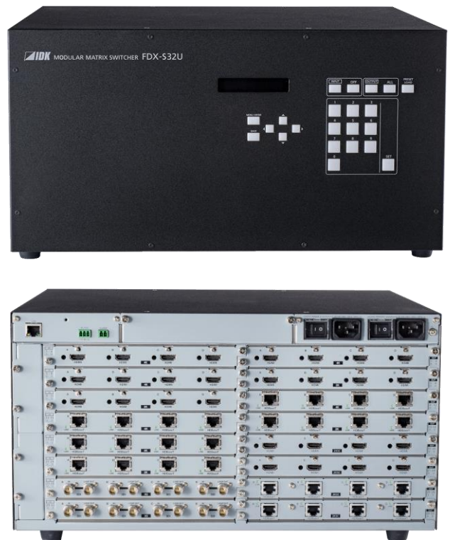
UVP: CHF 18'283.00 exkl. MwSt./VRG & Porto